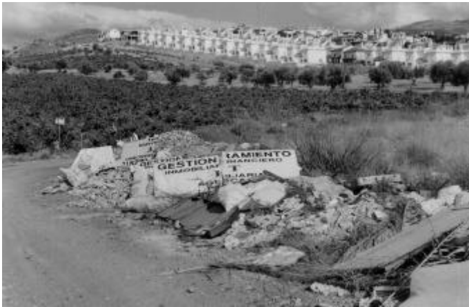
REBITE - CAMINO DEL LORADOR Sin comentarios