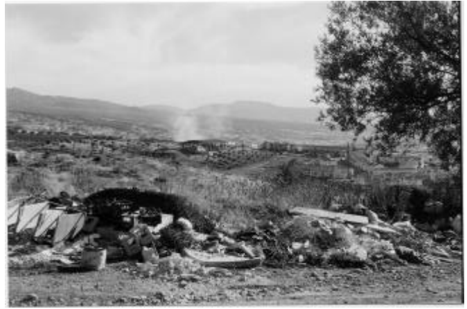
CAMINO FORESTAL - LOMILLA BLANCA HACIA CAMINO DE LOS NEVEROS Sin comentarios