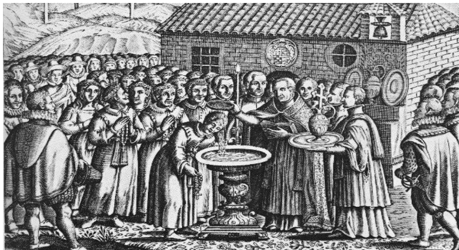
Bautismo de moriscos según F. Heiland

La expulsión definitiva de cerca de trescientos mil musulmanes, convertidos o no, sería ordenada en 1609 bajo el mandato de Felipe III, y se